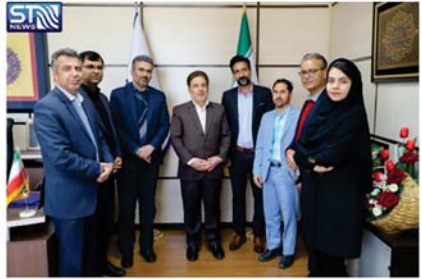
اعضای هیات مدیره هیات همکارانه علم و فناوری از دانشگاه بیرجند، شرکت تعاونی مودت فانی و مرکز رشد واحدهای فناوری سوره سنان

تفاهات نامه همکاری فو ماسن دانشگاه بیرجند، شرکت تعاونی مودت فانی و مرکز رشد واحدهای فناور این شهرستان با امضاء رئیس دانشگاه بیرجند و مدیر روابط خراسان جنوبی.