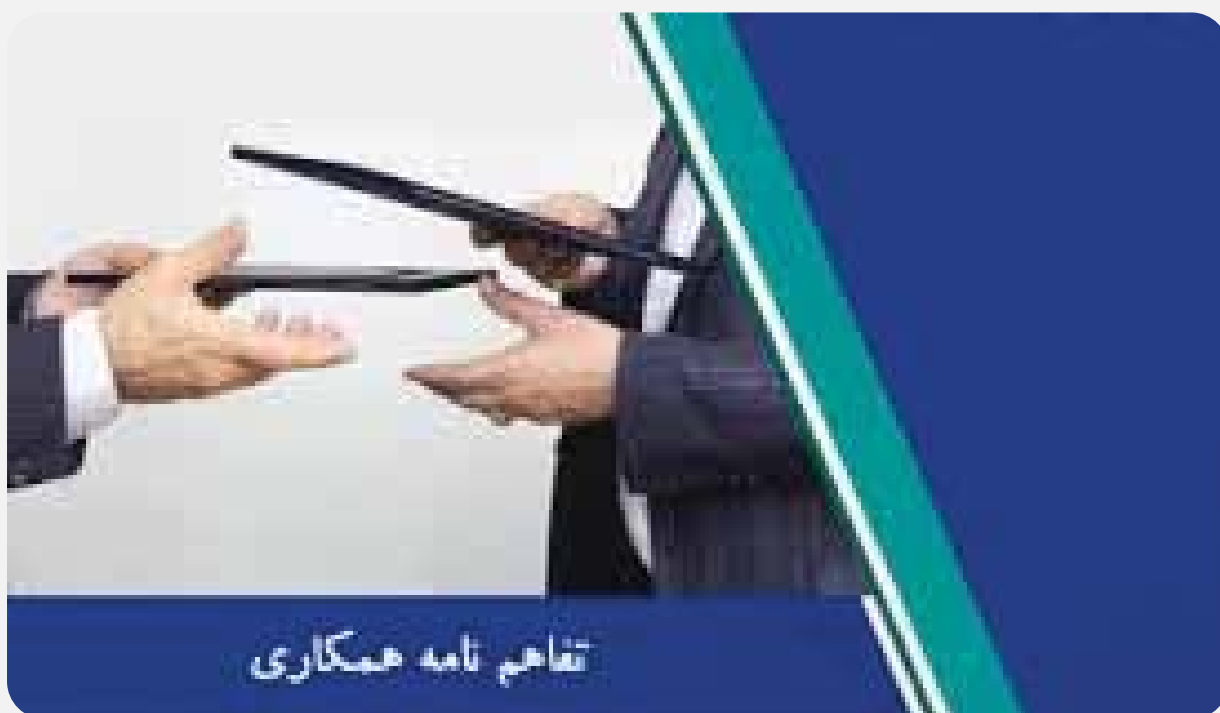
تفاهم نامه همکاری

دارویی استان) مراحل دریافت و حمایت از طرح های پژوهشی توسط بنیاد به شرح ذیل تشریح می گردد. ۰۱. طرح های منتخب واجد شرایط تفاهم نامه بایستی به همراه معرفی نامه آن دانشگاه با ذکر ماموریت مرتبط، توسط پژوهشگر در سامانه طرح های پژوهشی صندوق به آدرس rtms.insf.org بارگذاری شود. ۰۲. صندوق پس از دریافت طرح نسبت به داوری طرح اقدام خواهد نمود. ۰۳. در صورت تصویب طرح در صندوق، تفاهم نامه حمایت با پژوهشگر منعقد و فرآیند اجرای طرح آغاز می شود.