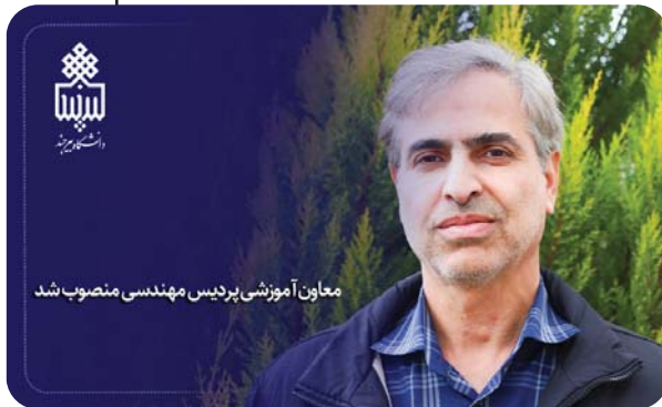
معاون آموزشی پردیس مهندسی منصوب شد