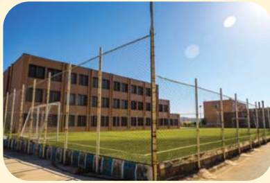
این خصوص مانند خوابگاه‌های مجردی بتوانیم همه درخواست‌ها را پوشش دهیم

شد: در سفر دوم هیات دولت به خراسان جنوبی در خصوص خوابگاه‌های متاهلی ۲۰ میلیارد تومان اعتبار مصوب شده است. معاون دانشجویی دانشگاه بیرجند افزود: با توجه به برنامه وزارت علوم، تحقیقات و فناوری در خصوص نهضت تامین خوابگاه‌های متاهلی دانشگاه‌ها، در استان نیز این مهم را پیگیری می‌کنیم تا در