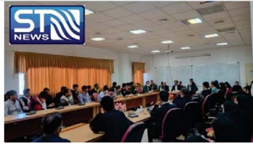
برگزار سمینار موفقیت در مهندسی با حضور ۶۵ دانشجو در دانشگاه بیرجند

سمینار موفقیت در مهندسی به همت یک روز در سالن جلسات پردیس دانشگاه بیرجند توسط هیئت کارآفرینی پردیس مهندسی برگزار شد.